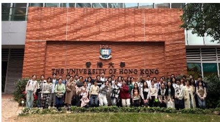
参访交流：香港大学