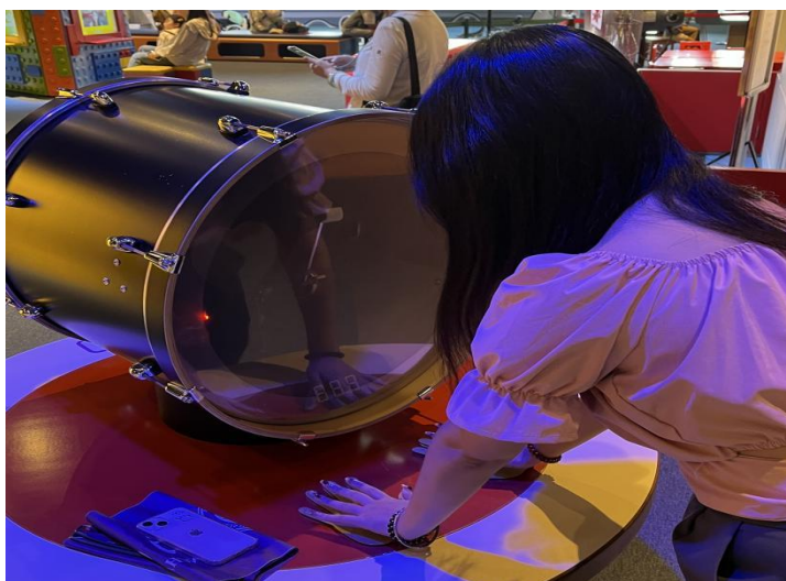
(Hong Kong Science Museum)

direct speaking country, but in fact, it was not, especially Israel.