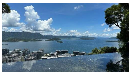
参访交流：香港中文大学