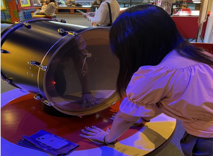
(Hong Kong Science Museum )

direct speaking country, but in fact, it was not, especially Israel.