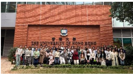
参访交流：香港大学