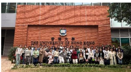
参访交流：香港大学