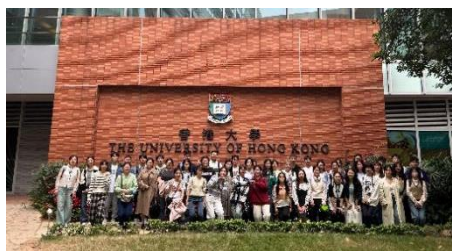
参访交流：香港大学